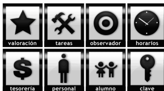
Fig. 4 Pantalla inicial del módulo WEB

Fecha Grupo Asunto Observaciones 08/09/08 7B IV informe de investigación Sociales ver